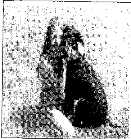
Brief der Aids-Hilfe Schweiz (S. 2)