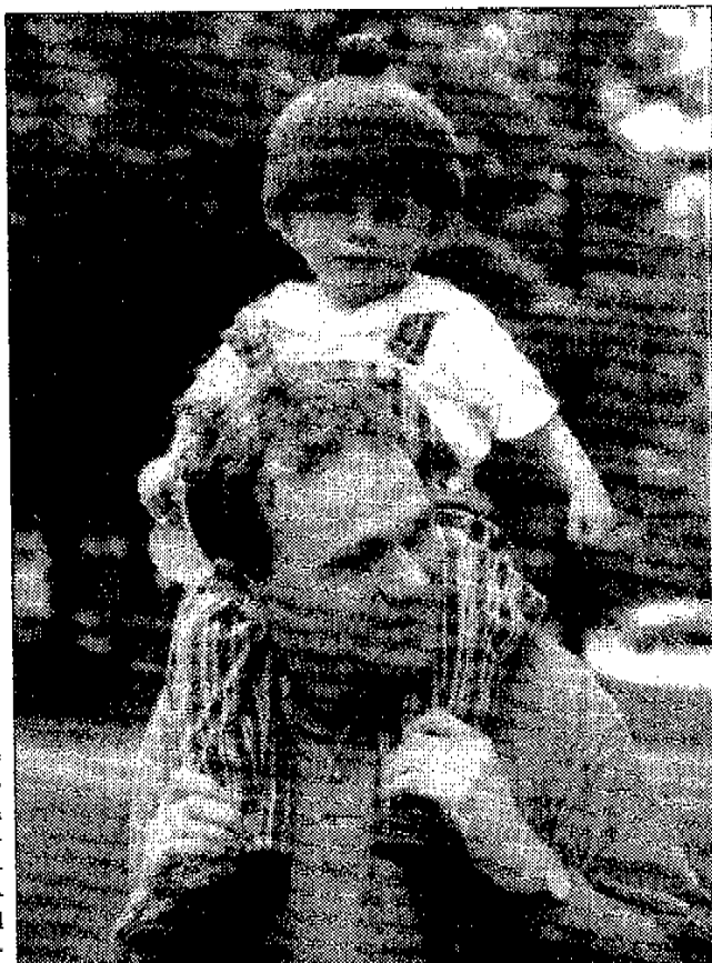
Leben schützen und erhalten ist auch die vornehmliche Pflicht aller Eltern.

Zum Selbstverhältnis der AIDS-Aufklärung Schweiz meinte Dr. Fantacci: «Wir finanzieren unsere Aktivitäten mit 50 000 Spendern. Steuergeld brauchen wir nicht, keinen Franken. Unsere Informationen sind stets korrekt und richten sich an Ärzte,